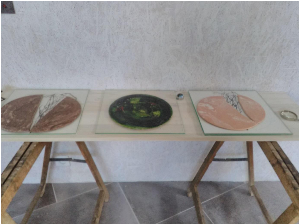
Exposition Résonance , Atelier Grange de Bernadette Wiener, 2018

Encre, papier, argile ; loupes. 37X37 chacune des 3 pièces.