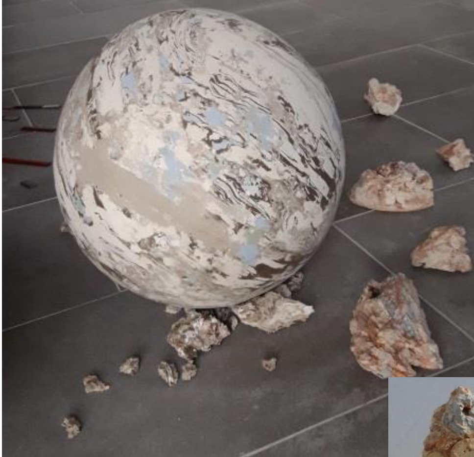
Exposition résonance Atelier Grange de Bernadette Wiener

Terres et fragments -argiles, papier, sables 100X60cm